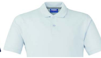
02 – WHITE