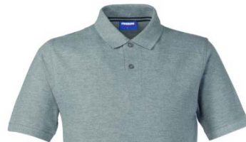
12 – GRIGIO MELANGE