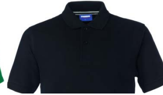
05 – NERO