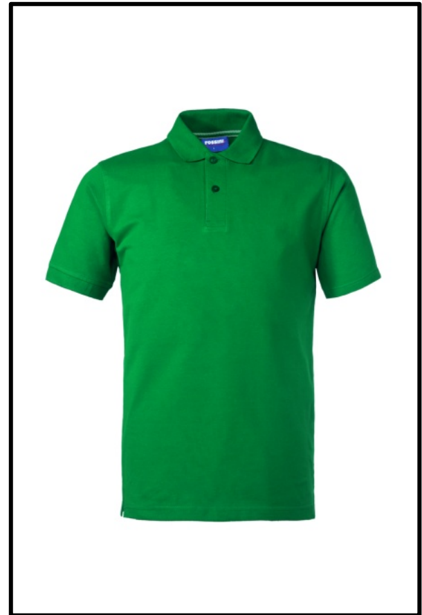
04 – VERDE