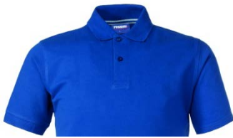
06 – AZZURRO ROYAL