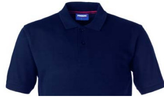
01 – BLU