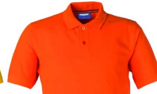
09 – ORANGE