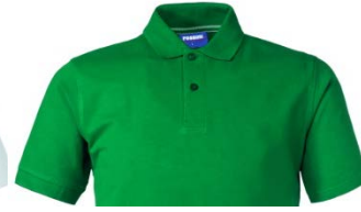
04 – VERDE