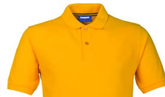
08 – GIALLO