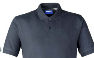
16 – ANTRACITE