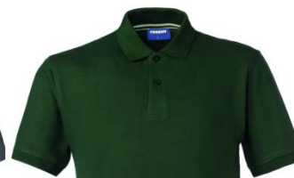
51 – BOTTLE GREEN