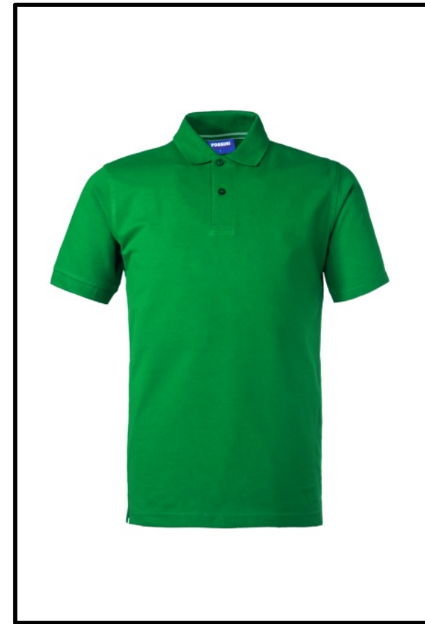
04 – GREEN