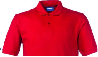
07 – ROSSO