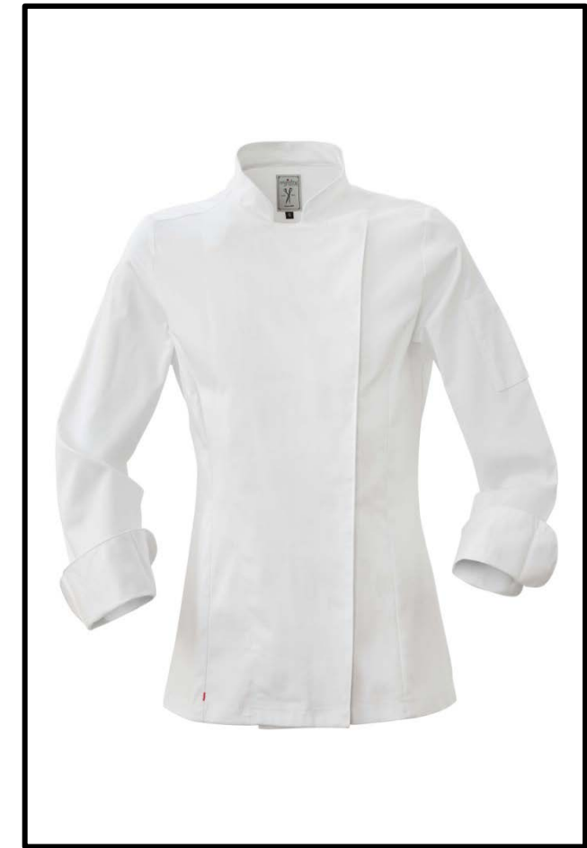
02 – BIANCO