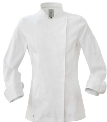
O2 – WHITE

Chef's jacket for women, with snap buttons closure, slim fit.