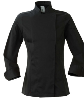
05 – NERO