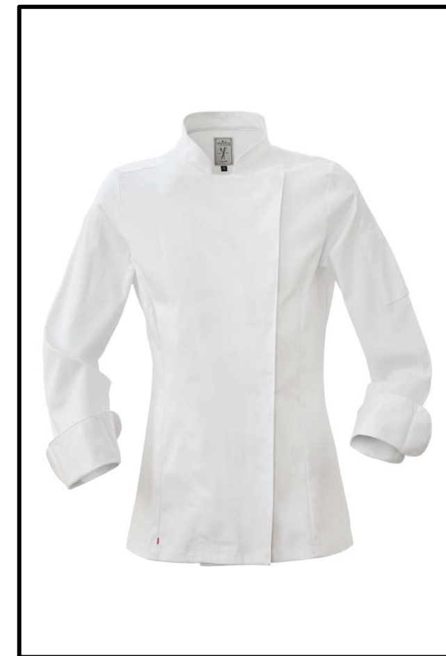
O2 – WHITE